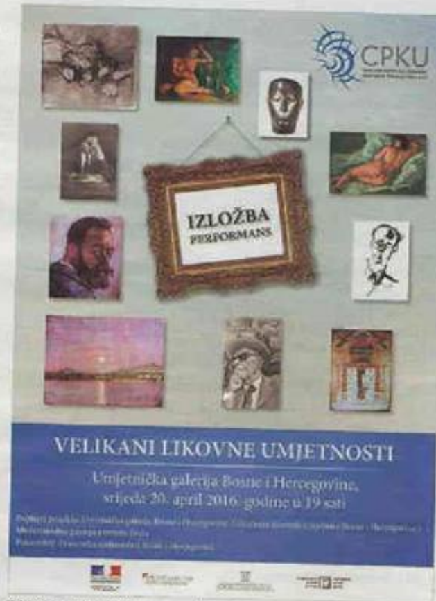
Izložba Velikani likovne umjetnosti

Takođe, predloženo je da se ova problematika stavi na listu prioriteta nadležnih sigurnosnih agencija, te da predstavnici državnih institucija ovu temu drže u fokusu kao jako značajnu za našu zemlju. Pored navedenog, jedan od važnijih problema sa kojima se u BiH susreću institucije i pojedinci koji se bore protiv ilegalne trgovine umjetničkim djelima, leži u oblasti zakonodavstva. Taj problem se, prije svega, odnosi na zastaru krivič-