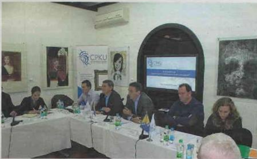
Konferencija "Ilegalna trgovina umjetninama u BiH"

je i galeristike. Jedna od značajnijih aktivnosti CPKU je saradnja sa Umjetničkom galerijom Bosne i Hercegovine, Udruženjem likovnih umjetnika Bosne i Hercegovine. CPKU aktivno radi i na formiranju mreže stručnih muzejskih i galerijskih radnika, ali i srodnih institucija i pojedinaca, s ciljem povećanja protoka informacija i zajedničkog nastupa na polju zaštite kulturnih dobara. S tim u vezi, potpisani su protokoli o saradnji sa mnogobrojnim institucijama na području cijele Bosne i Hercegovine. Posebno značajnu podršku u radu CPKU daju British Council, francuska ambasada u Bosni i Hercegovini, kao i USAID BiH", kaže Jusufović.